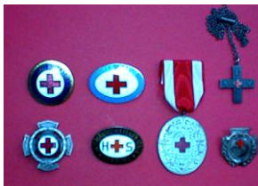
Orden und Ehrenzeichen...