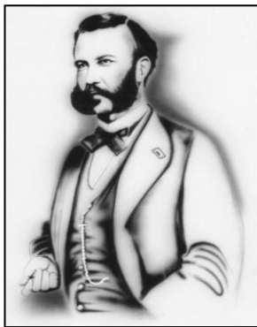
Henry Dunant (1828 – 1910) Begründer des Roten Kreuzes