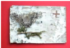
Postkarten 1. Weltkrieg...