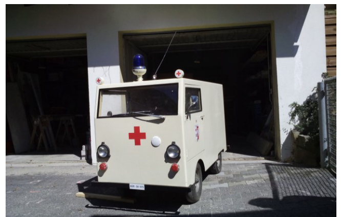
Restaurierung des "Modell-KTW"