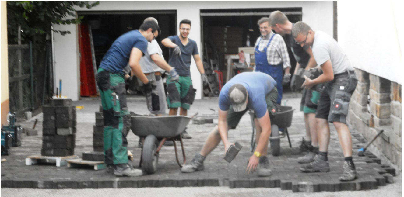
Pflasterung der Einfahrt