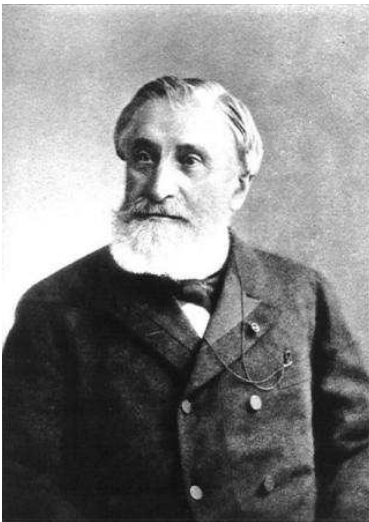
† 21.08.1910 Gustave Moynier...